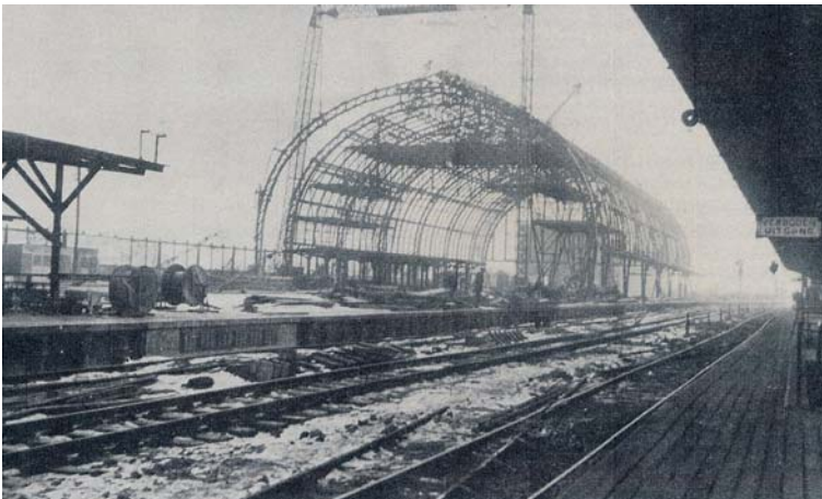
De bouw van de tweede stationskap over het reeds gereedgekomen vierde, vijfde en zesde perron. Het tijdelijke, houten vierde perronis hier voor het leggen van de definitieve sporen reeds opgeruimd.